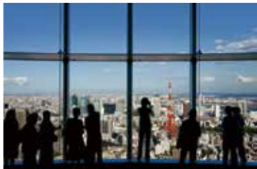
東京シティビュー