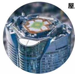
屋上 スカイデッキ